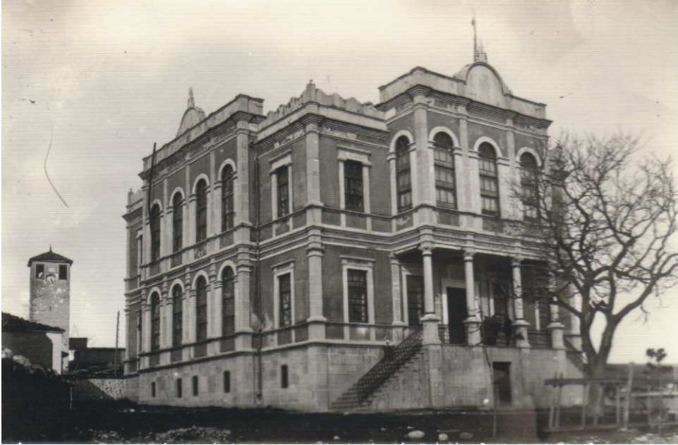
Safranbolu Hükümet Konağı'nın yanmadan önceki çok eski bir görünümü

Tarih 19 Ocak 1976, soğuk bir kış gecesi, ısı sıfırın altında 15 derece dolaylarında, saat 21.00 suları... Safranbolu'nun simgelerinden Kale'deki Hükümet Konağı yanmaya başlar, ateşi gören, arkadaki Cezaevi'nin nöbetçi jandarma eri itfaiyeye haber verir. İtfaiye 10 dakika içinde yangın yerindedir. Sokaklar yalçın buzlarla kaplıyken, 5 ton su taşıyan itfaiye aracının, çok dik yokuşu tırmanarak yangın yerine ulaşabilmesi mucizedir.