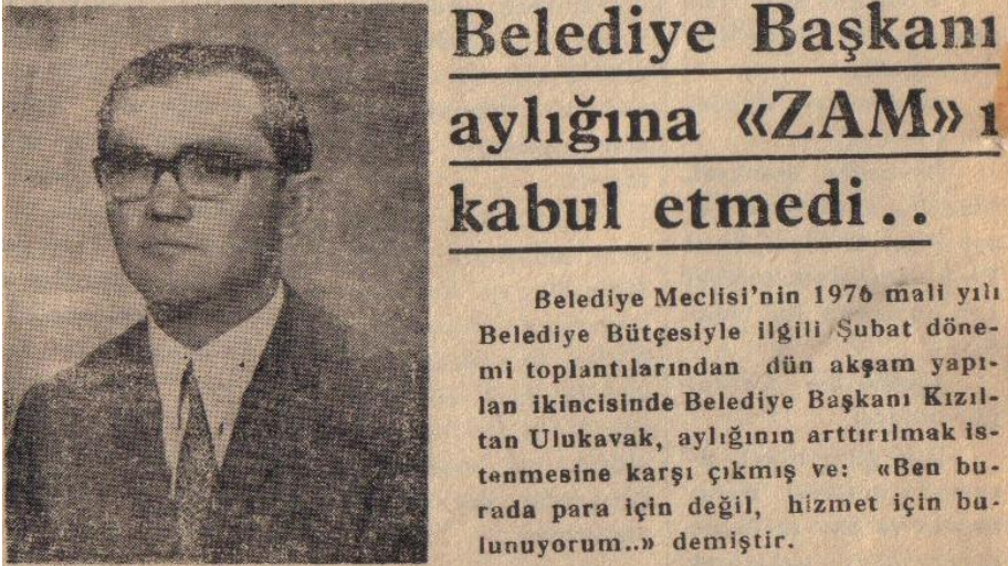
Safranbolu'da İLKSES Gazetesi ( 17.02.1976)