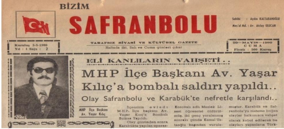
Bizim Safranbolu Gazetesi (30.05.1980)

Bu sırada liseden gelen öğrencilerin “kana kan, intikam” diye bağırdıklarını ve her tarafı pencere camı kırıklarıyla kaplı zemine kendilerini atarak ağlaştıklarını görünce, niçin götürüldüğümü ancak anlayabildim.