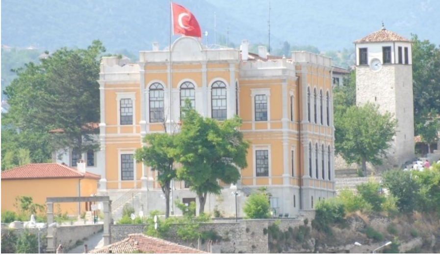
Safranbolu'nun eski Hükümet Konağı; Safranbolu'nun yeni Kent Tarihi Müzesi