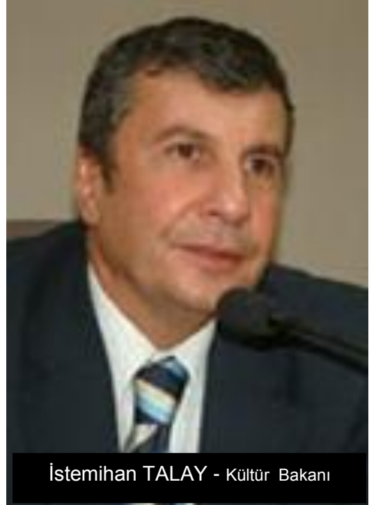
İstemihan TALAY - Kültür Bakanı

Aynı gün yapılan törendeki konuşmamda, binanın yanmasına ve yangın sonrası geçirdiği serüvene değinirken, Hükümet Konağı yangınıyla Safranbolu Kalesi'nin düşmüş olduğunu, Kale bayrağının indiğini, spor deyimiyle Kaleye giren gollerin 25 yıldır çıkartılmadığını, kente en egemen noktadaki bu binanın, kentin her yerinden göze çarpan yanmış görüntüsüyle, Safranbolu'nun tarihsel dokusunu çeyrek yüzyıldan bu yana kararttığını dile getirmişt看m.