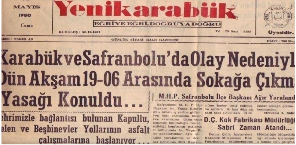
Yeni Karabük Gazetesi - 23.05.1980

dim. Zonguldak Valiliği'nin, olay günü 22 Mayıs 1980 Perşembe gecesi saat 19.00'dan, ertesi sabah 06.00'ya kadar Karabük ve Safranbolu'da sokağa çıkma yasağı koyduğu haberi geldi, Belediye hoparlöründen anons edildi. Orta dereceli okullar da hafta başına kadar tatil edilmişti.