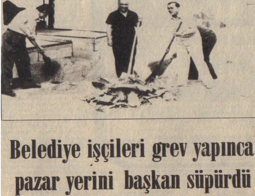
Hürriyet Gazetesi – 18.07.1979 (Grev, bu tarihte bir gün önce son bulmuştu)

Bir gün erkenden Ankara'ya, işçilerimizin üyesi olduğu Genel İş Sendikasının Genel Merkez yetkilileriyle görüşmeye gittim. Yanımda Şube Başkanının muhalifi, Sendikanın eski sekreterini de götürdüm. Aslında, Sendika Genel Merkez yetkililerinden de, Belediyelerin içinde buldukları dar boğazlar konusunda, daha anlayışlı davranışlar beklemiyordum.