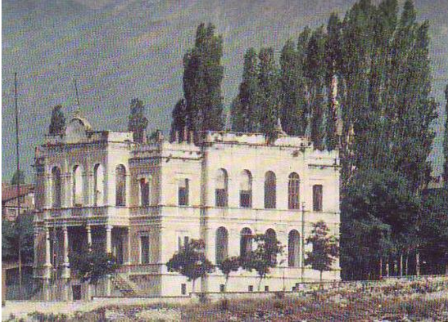
Hükümet Konağı'nın yangın sonrası görüntüsü

Binanın çatısına yangın için konulmuş tankın içindeki su, yangın çatıdan başladığı için kaynar hale gelmiş. Bu tanka bağlı hortumun üst kattaki vanası açıldığında, dışarı fışkıran kaynar su, çok soğuk ortamda kesif bir buhar tabakası oluşturmuş; göz gözü görmez olmuş. Bu nedenle yangına mevcut yangın tankının suyuyla hemen müdahale olanağı kalmamış.