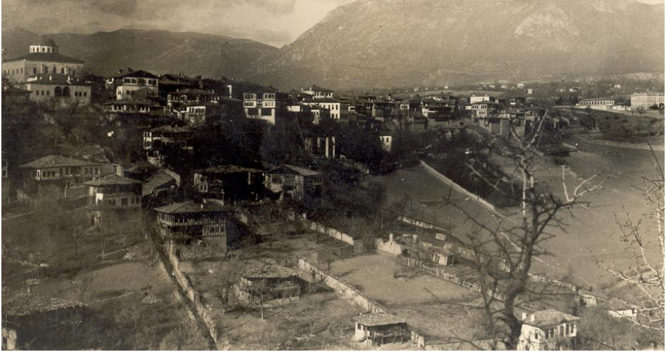
Gümüş semtinden bakıldığında Kıranköy sırtlarının eski görünümü