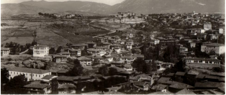
Tabakhane yöresinden çok eski bir görünüm

Şehir’deki eski ahşap evlerin satış bedelleri çok düşüktür; bu evlerin bakımından bıkmış, temizliğinin zorluğundan usanmış, onarımından yılmış ve bu nedenlerle günün modasına uyarak tuğla, çimento ve demirden yapıma kargir evlerde oturma özlemine girmiş Safranbolulular, evlerini yok pahasına da olsa satmağa hazırdır. Alıcılar ise sadece komşu ilçelerden değil, yurdun dört bir köşesinden gelip, Karabük’te çalışma olanağı bulsa da, konut edinme olanağı bulamayanlardır. Onlar sayesinde Safranbolu yeni yeni hemşehriler kazanmakta ve kent nüfusu hızlı bir artış sürecine girmiş bulunmaktadır. Daha ileriki yıllarda, tüm yurt düzeyinde kırsal kesimden, kente olan göçün ivme kazanmasıyla, Safranbolu kent nüfusu da, çok daha büyük oranlarda artacaktır.