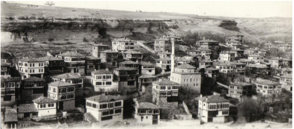
Akçasu Mahallesi ( 1940 )

1970’li yılların başında, Safranbolu yerlileri gibi, kamu görevlilerinin de büyük kısmı Bağlar’da oturmaktadır. O tarihlerde Cumartesi günleri de saat 13.00’e kadar çalışılmaktadır. Diğer günler mesai saatleri saat 9.00-12.00 ve 13.30-17.00 arasında olduğundan, saat 12.15 ve 17.15’de Şehir’den hareket eden Belediye otobüsleri memur servisi gibidir.