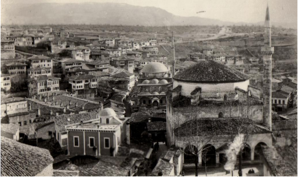
1940'lı yıllarda Safranbolu'nun tarihsel kent merkezi (ŞEHİR)

Esnaf ve zenaatkarların 1950'li yılların ortalarında başlayan ve artarak devam eden, çarşı'daki dükkanlarını kapatarak, Demir-Çelik fabrikalarında işçi olmak veya Karabük'te yeni dükkan açmak arzuları, 1970'li yılların başında Safranbolu'daki ticari hayatın çok büyük ölçüde sönmesine yol açmıştır. Karabük esnafının önemli bir kısmını, artık eski Safranbolu esnafı oluşturmaya başlamış ve bu arada, ekonomik olanakları daha uygun olanlar da, Safranbolu'daki dükkanlarını kapattıktan sonra, Karabük'te İstasyon civarı ile Hürriyet Caddesindeki yazihanelerinde demir tüccarı ve nakliyeciler olmuşlardır. Safranbolulu esnaf ve ticaret erbabının ikametgahı Safranbolu olsa da, işyerleri artık, genellikle Karabük'tedir.