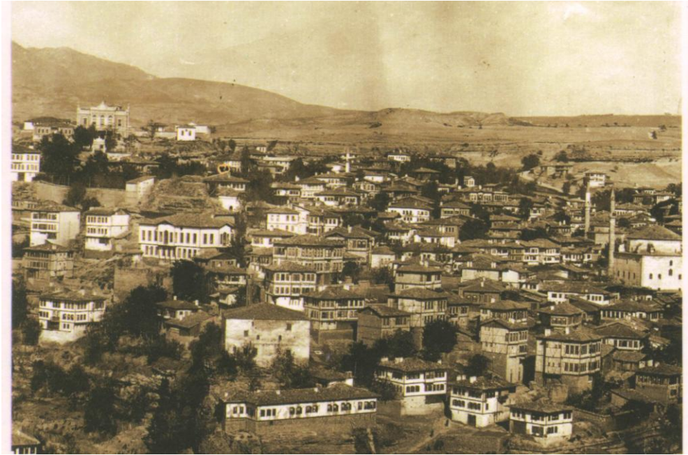
Geçmiş yıllar Safranbolu'sundan bir başka kesit'