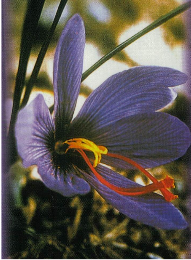
SAFRAN "Crocus sativus L." Çiçeđi ( Prof.Dr. İbrahim GÜMÜŞSUYU-Safranbolu Hizmet Birliđi, Safran Broşürü kapađı)

Safran'la ilgili olarak sadece, safranlı sütlaç'a "zerde" denildiđini biliyordum. Bir de, safranın bir biriminin 100.000 birim suyu sarıya boyayabilecek kadar güçlü olduđunu bir ansiklopedide okumuştum. (4) İspanya Büyükelçisi gelmeden önce çaresiz, safran tarımını bilen kişileri aratıp buldurarak, yetersiz de olsa bilgi aldım. Meydan-Larousse Ansiklopedisi'nin safran maddesini okuyunca da, Dünya safran üretiminde ve dış ticaretinde, İspanya'nın en önde olduđunu öğrendim.