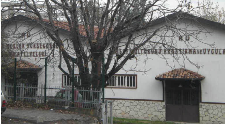
Zirai Donatım Kurumu’nun tesisleri, 2000’li yıllarda Karabük Üniversitesi ile Safranbolu Meslek Yüksek Okulu’nun kullanımına bırakıldı

Çok uzun zaman sonra, 2000’li yılların başlarında, T.Zirai Donatım Kurumu özelleştirme kapsamına alındığında, yurt düzeyindeki tüm taşınmaz malları satılırken, Safranbolu’daki bina ve arsalarının, özel kişilere satılmaktansa, kamunun elinde kalıp, önce Zonguldak Karaelmas Üniversitesi, sonra Karabük Üniversitesi Rektörlükleri adına Safranbolu Meslek Yüksek Okulu’nun kullanımına bırakılması çok yerinde oldu. Bu konuda Başbakanlık Yüksek Denetleme Kurulu’ndaki görevim nedeniyle yakın ilişkide bulunduğum Özelleştirme İdaresi Başkanlığı nezdinde, konunun Safranbolu için taşıdığı önemi anlatarak başka ilgilenenlerle birlikte, ben de yardımcı olmağa çalıştım.