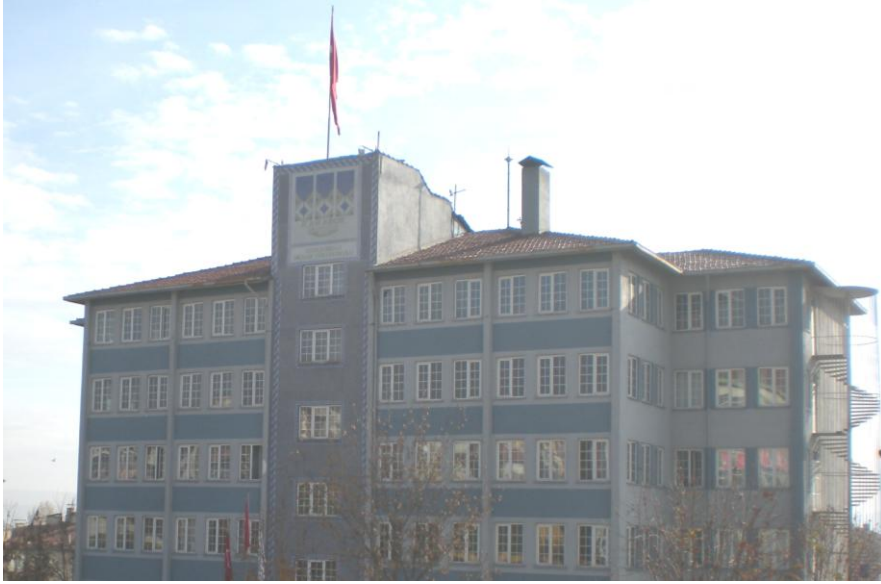
Dava konusu arsaya yapılan bina, 1990'larda Safranbolu Meslek Yüksek Okulu oldu

ettim. İdare temsilcisi şu talepte bulundu diye istemimi yazdırdı; sonra, “ Gereği düşünülür, talebin reddine karar verildi ” diyerek tutanağı bağladı.