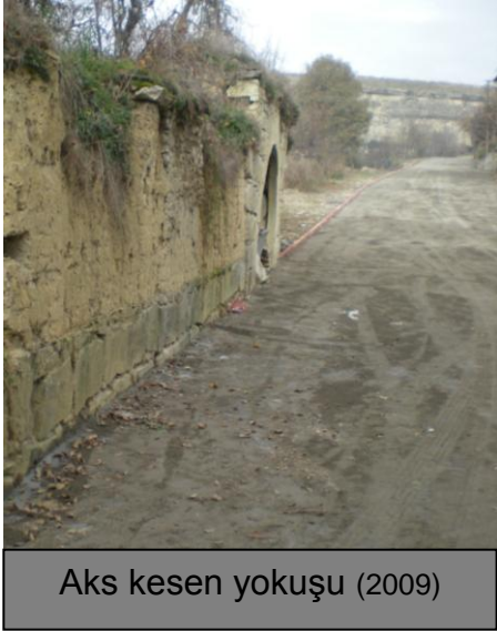
Aks kesen yokuşu (2009)

Sayın ASMAZ Amca'nın en büyük hayırseverliği ve herkese örnek olacak unutulmaz davranışı, bahçesinin tam ortasından, bahçenin yarısından fazlasını kaplayacak biçimde yol geçirilmesine izin vermekle Safranbolu'ya yaptığı çok büyük bağıştır.