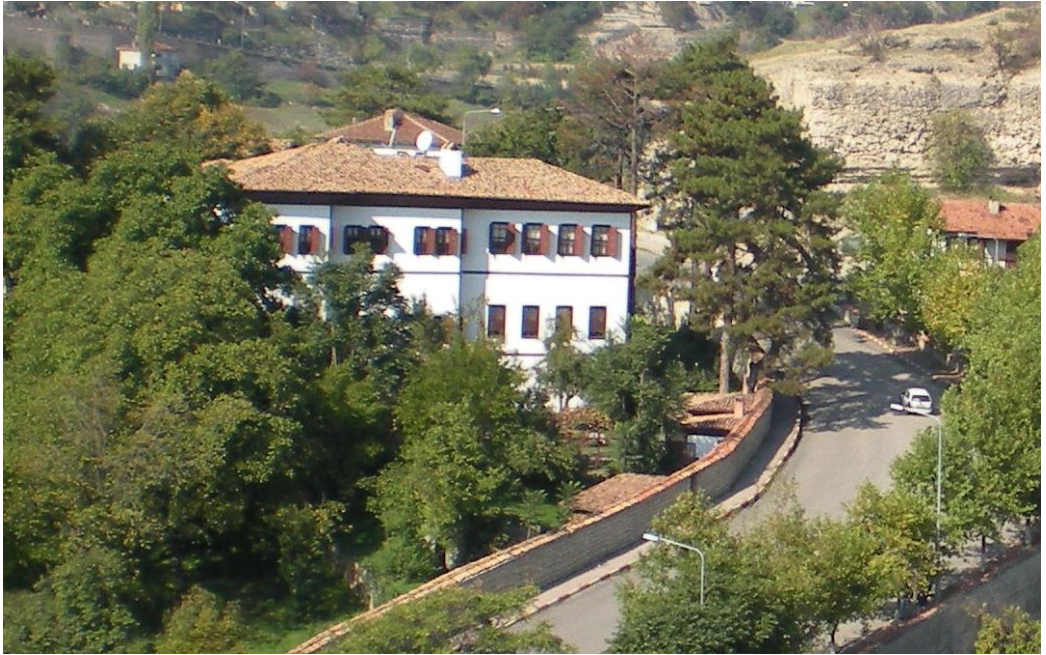
Hacı Sabri Asmaz Geçiti ve kesilen Beybağı Kayası

En büyük sıkıntı, geniş araçların geçişi sırasında yaşanıyordu, bu yolun Kilcioğlu camii yakınındaki en dar yerinde, dikkatsizlik sonucu, ne yazıkki Beşgöz'den bir gencin, bahçe duvarı ile araç arasında kalarak ezilmesi, çok üzücü oldu.