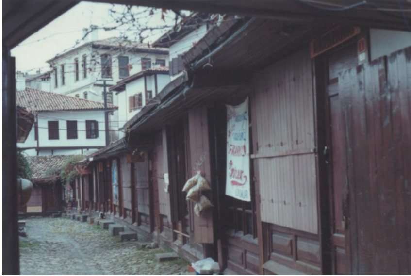
Üstte restorasyon öncesi; altta restorasyon sonrası ARASNA