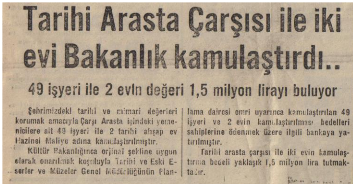
Safranbolu'da İLKSES – 08.12.1978