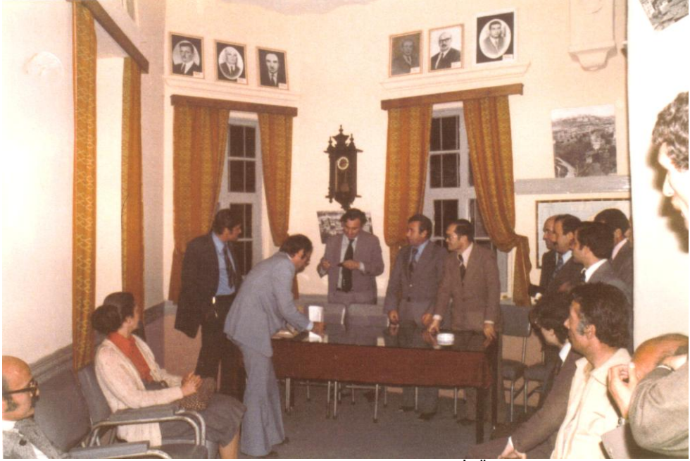
, Belediye Başkanlık odasında, Kültür Bakanlığı yetkilileri ile İTÜ öğretim üyeleri arasında, "Safranbolu Koruma Amaçlı İmar Planı"nın yapımına ilişkin protokol imzalanıyor (23.09.1978)