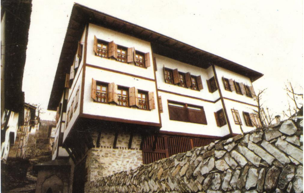
Restorasyon sonrası KAYMAKAMLAR EVİ

Bakana verdiğim söz gereği, Arasna'daki kamulaştırmaların bir an önce sonuçlandırılması için büyük çaba gösterdiysem de, kamulaştırma bedeline itirazların yargı mercilerinde karara bağlanması zaman aldı. Dolayısıyla onarımın başlaması ve bitirilmesi gecikti. Ancak geç de olsa Arasna kurtarıldı. Bugün aradan yıllar geçtikten sonra bile, hala Arasna'daki dükkanım elimden alındı diye söylenenleri, "mal canın yongasıdır" diye anlayışla karşılamak yerine, "kör ölür badem gözlü olur" diye değerlendirmek daha uygun olacaktır. Kamulaştırma yapıp Arasna kurtarılmasaydı, dükkan sahiplerinin kamulaştırma sonucu, az veya çok bir bedel almaları bir tarafa, Arasna dükkanlarından geriye sadece enkaz kalacaktı.