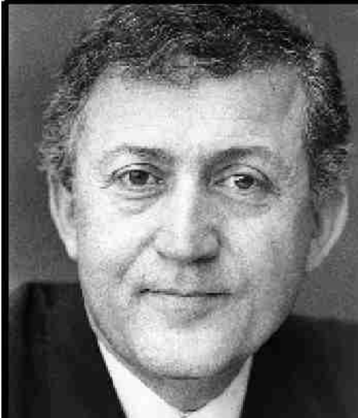
Ahmet Taner KIŞLALI –Kültür Bakanı

Hiç kuşkusuz bilim, sanat, kültür çevreleri ile basın ve yayın kuruluşlarının ilgi odağı olması, Safranbolu'nun tanınmasında ve korunmasında çok önemli bir aşamayıdır. Ancak yeterli değildi, korumanın duygu ve söylem alanından, eylem alanına geçirilmesine ve bunun için de Devletin devreye girmesine gereksinim vardı. Zamanın Kültür Bakanı Doç.Dr. Ahmet Taner KIŞLALI'nın Safranbolu'ya gelmesi, Safranbolu'nun Devlet'in koruyucu kanatları arasında yer bulmasını sağlayan bir dönüm noktası olacaktı. Nitekim öyle olduğu, hiçbir duraksama olmaksızın söylenebilir.