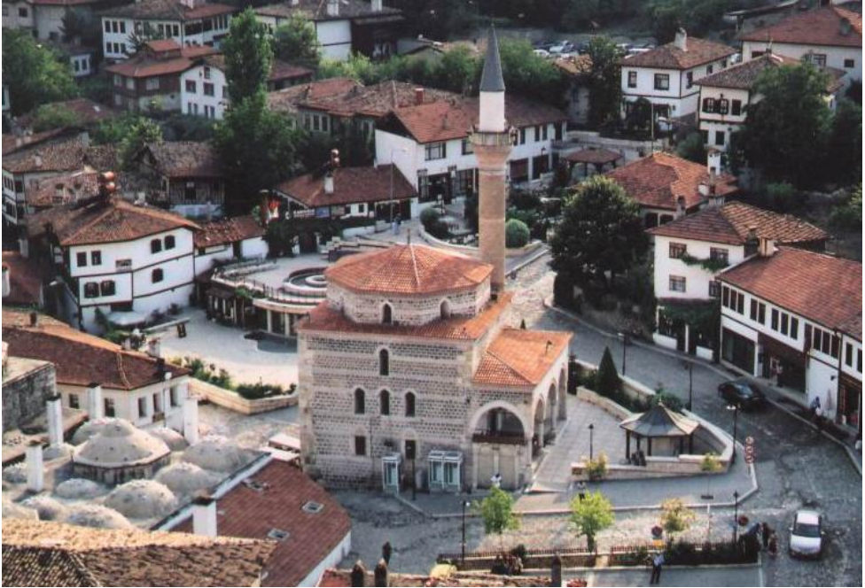
Camiye bir şadırvan da eklenerek Kazdağlıoğlu Meydanında, 2000 yılında gerçekleştirilen, çevre ve kent dokusuyla uyumayan düzenlemeden sonraki görünüm

1993 yılındaki Safranbolu Haftası'nda, Muvakkithanenin daracak mekanında, Safranbolu ile ilgilerini ve kim olduklarını bilmediğim kişiler, gelen konuklara kitapları gösterirken, gördüklerim karşısında dayanamadım, oradan çıkıp gittim.