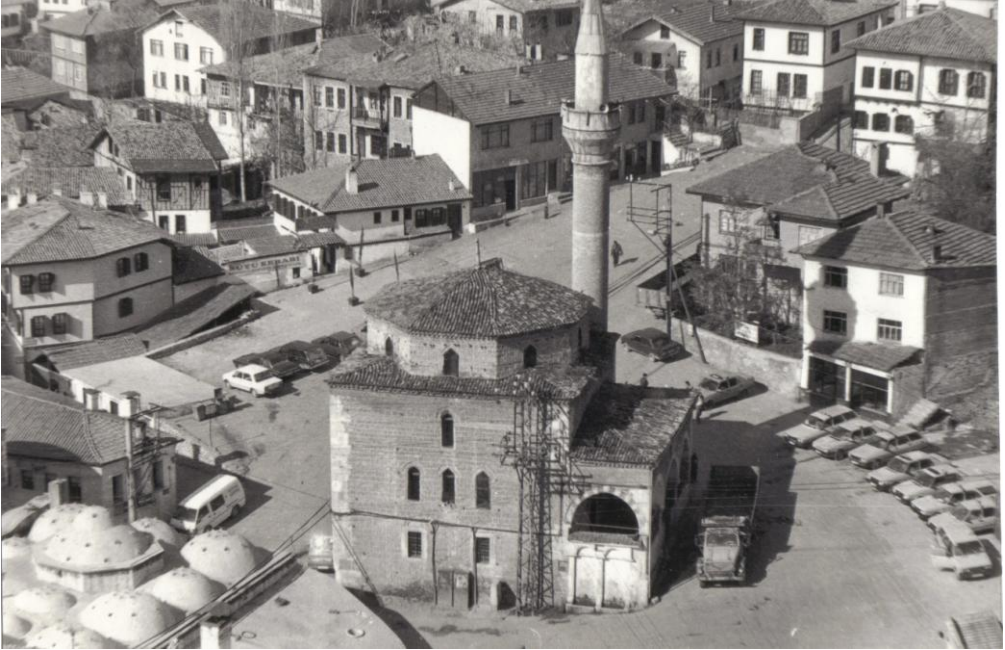
Kazdağlıoğlu Camii ve çevresinde kamulaştırmalar sonrası açılan meydan (1976)