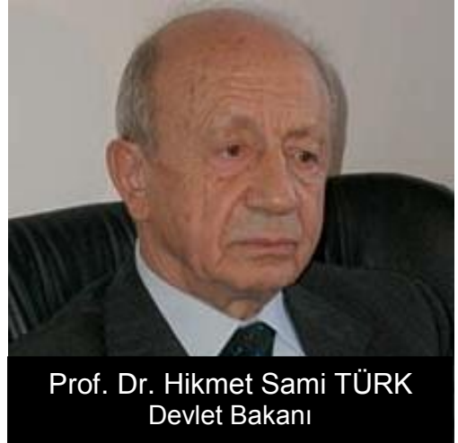
Prof. Dr. Hikmet Sami TÜRK Devlet Bakanı

.Ağustos/1998 sonunda Bakanlar Kurulu Kararnamesi'yle Başbakanlık Yüksek Denetleme Kurulu üyeliğine atandım. Benimle birlikte atanan Kurul Başkanı ile diğer üyeleri, yanda bir fotoğrafı yer alan Kurulumuzun bağlı olduğu Devlet Bakanı Prof.Dr. Sayın Hikmet Sami TÜRK, atama kararnamesinde imzaları bulunan Cumhurbaşkanı ve Başbakan ile birlikte, koalisyon ortağı siyasi partilerin genel başkanları olan Bakanlara ve dolayısıyla Başbakan Yardımcısı Bülent ECEVİT'e de takdim etmeyi uygun bulmuştu. Sayın ECEVİT'le 19 yıl sonra, Ekim/1998'te ilk kez karşı karşıya geliyordum. Doğal olarak beni sima olarak tanımaları da, isim olarak