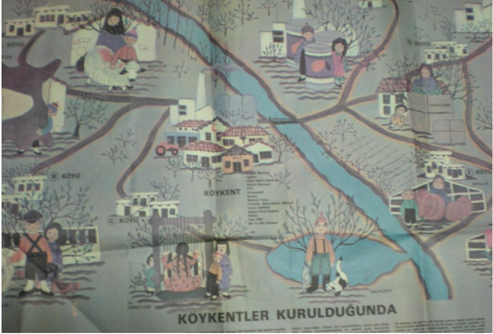
CHP'nin krokilerle "Köykent"i tanıtmı için hazırladığı büyük boyutlu poster