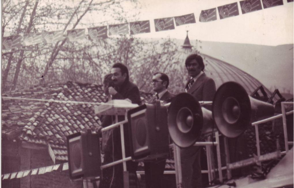
Bülent ECEVİT, iki yıl önce açılan Kazdağlıoğlu meydanında seçim otobüsünden - CHP Belediye Başkan adayı da yanında - Safranbolululara sesleniyor (24.11.1977)

Çarşı'da CHP İlçe binasının önünde, iki yıl önce açtığımız Kazdağlıoğlu meydanında, seçim otobüsünden halka hitap edecekti; benim de kendileriyle birlikte otobüsün üstüne çıkmamı istedi. Konuşmasında hangi konulara ağırlık vermesinin uygun olacağına ilişkin sorusunu, " Safranbolu'daki kültürel değerlerin korunmasında Devlet katkısı sağlanacağını duyurmanızın yararlı olacağını takdirlerinize sunarım " diyerek yanıtladım.