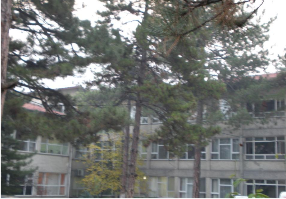
Ağaçlar kesilerek, yukardaki alana hastaneye bitişik Sağlık Ocağı yapmağa kalkışmak "ben kamuyu temsil ediyorum, istediğimi yaparım" anlayışından kaynaklanıyordu

ruhsatı alınmasını gerektirse de, genellikle kamu kurumları, yaptıkları ihale sonrası bu kurala uymaksızın inşaatı başlatırlar. Belediyeler de yöreye bir yatırım yapıyor, hizmet geliyor diye düşünerek ve bu arada inşaatın, Devletin kontrol mühendisi unvanıyla görevlendirdiği bir teknik elemanın gözetiminde yapılacağını da bildiklerinden, ruhsat nedeniyle sorun çıkartma gibi bir konumda bulunmak istemezler.