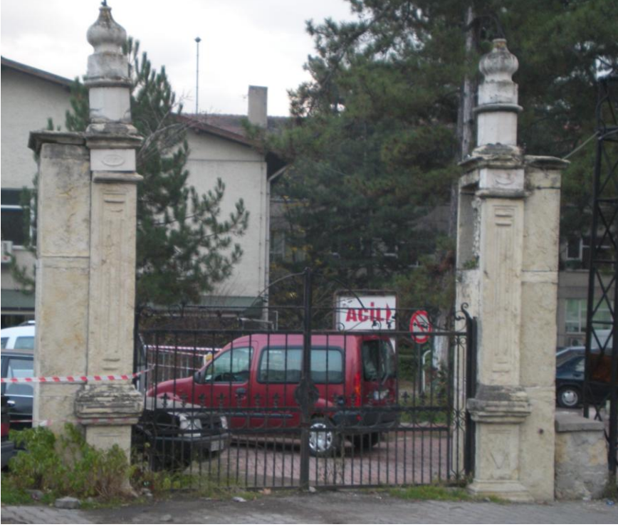
Eski hastanenin tarihsel nizamiye kapısı

dilediğiniz genişlikte bir kapı yeri bırakın, aksi takdirde hakkınızda hemen yasal işlem yaptırırım” dedim. Uyarıma uyuldu; tarihsel değer taşıyan kapının korunmasını, Mustafa GÜNGÖR’ün duyarlılığına ve bu uyarıya borçlu bulunuyoruz.