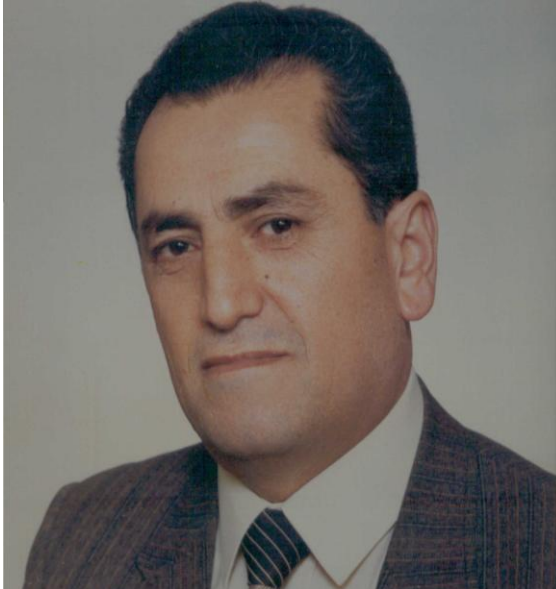
Galip DEMİREL - Zonguldak Valisi

Konarılılara Vali'yi tanıttım, köy halkı çok büyük ilgi gösterdi, arka arkaya izzet ikramda bulundular; ağızları laf yapan güngörmüş kişilerdi, sorunlarını anlattılar. Sayın Vali sadece bir çay içecek kadar kalmayı düşündükleri Konarı'da, bir saati aşkın süre eylenerek halkla haşır neşir oldu; memnun kalmış olarak Safranbolu'ya dönmek üzere arabaya bindik.