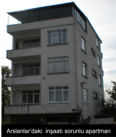
Arslanlar'daki inşaatı sorunlu apartman