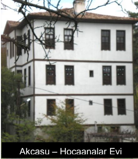
Akcasu – Hocaanalar Evi

çevresindekilerin, maiyetindekilerin yutmasına da göz yummamalıdır. Bu amaçla gereken önlemler alınmalı, küçük de olsa hiç bir yolsuzluk asla hoş görülmemelidir. Şöyle bir olayla karşılaştım: