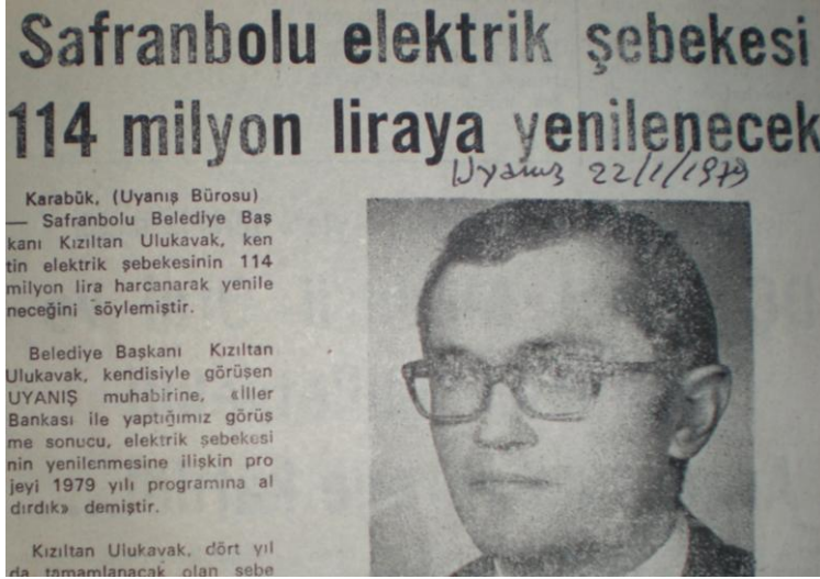
Zonguldak Uyanış Gazetesi – 22.01.1979

çok sayıda trafo yerleştirilmesi ve iletim hatlarının tamamen yenilenmesi öngörüldü. Ancak, Devlet Planlama Teşkilatı'nca yatırım programına aldırılan ve İller Bankası'nca da 1979 yılında, 114 Milyon lira keşif bedeli üzerinden iki kez ihaleye çıkılmasına rağmen, birim fiyatlarının uygun bulunmamasından dolayı, talipli çıkmaması nedeniyle projenin uygulamasına geçilemedi.