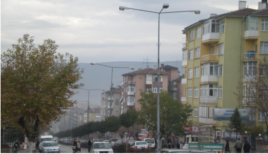
Bağlar Mahallesi bölünerek oluşturulan Yeni Mahalle'den bir görünüm

Kanunu'nun 8 inci maddesi, bu konuda öncelikle Belediye Meclis kararını, sonra İlçe İdare Kurulu kararı ve Vali'nin onayını öngörüyordu. Bu amaçla, Hastarlar'daki yeni yerleşim alanları, Arslanlar'a kadar "Yeni Mahalle", Akbayır yöresi "Cemal Çaymaz Mahallesi" ve Aşağı Tokatlı semti de, aynı adı taşıyan ayrı bir mahalle olmak üzere, Bağlar Mahallesi'nin kendi dahil, 4 mahalleye bölünmesi uygun bulundu.