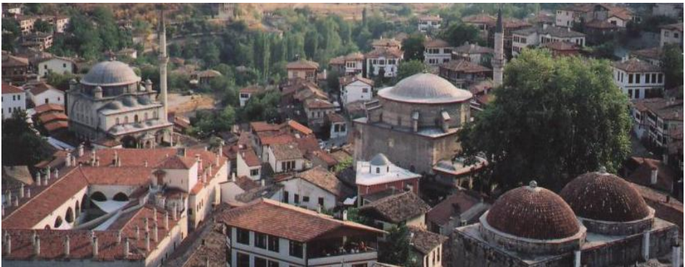
Safranbolu'nun tarihsel ve anıtsal nitelikteki eserlerinin bir bölümü ( Görünüm Hasanedede Kayası'ndan )