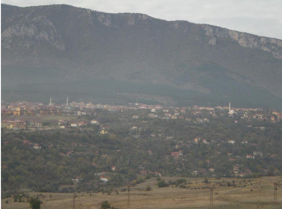
Taşharmanlar'dan, Bartın Karayolu kenarından A.Tokatlı Mahallesi'nin görünümü

Safranbolu'da elektrik şebekesinin uzanmadığı bir yerleşim yerinin kalmaması da ana hedeflerden birini oluşturuyordu. 1975 yılında Kayarlı Bağları'na, Akçasu mahallesi'ndeki itibaren direkler dikilerek, 2-3 Km kadar yeni iletim hattı tesisi edildi. Aynı yıl A.Tokatlı Mahallesi'nde de elektrik şebekesi, mahallenin iç kesimlerine, Çakaloğlu semtine ve Düz mahalle içlerine kadar yaygınlaştırıldı. Daha sonraki yıllar, Sülügölü, Dereköy, İsmetpaşa Mahallesi'nin kimi kesimleri ile Hacılar Pınarı ve Kurt Tepesi gibi uzak semtlere de Belediye olanaklarıyla yeni hatlar çekildi ve buralarda elektriğe kavuşturuldu.