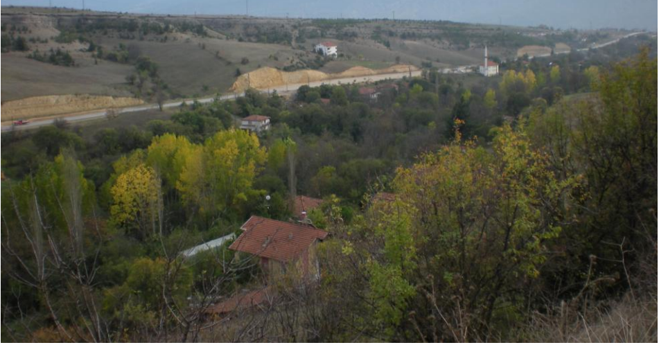
Taşharmanlar'dan Kayarlı Bağları'nın görünümü, (Üstte Kastamonu ile Bartın Karayollarını birbirine bağlayan çevre yolu)

Kayarlı'ya iki parmak su vererek, komşu semt sakinlerini temiz içme suyuna kavuşturmanın kendilerini ilgilendirmedğini, sularının alınıp, bostanlarının susuz bırakılmayacağını, suyun kendilerine ait olduğunu ileri sürüyorlar; nihayet iki parmaklık bir boruyla alınacak ve pompaj yapılması söz konusu olmaksızın, tabii cazibe ile akıtılacak kadar bir su alınacağını bilmelerine rağmen direniyorlardı.